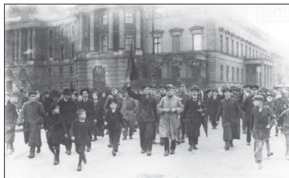
Berlijn: Rellen op 'Unter den Linden' vlakbij het operagebouw.

Werk sehr gefallen und wünsche ich demselben eine weitere glückliche Zukunft.'